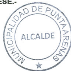
VLADIMIRO MIMICA CÁRCAMO ALCALDE