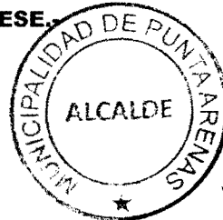
VLADIMIRO MIMICA CÁRCAMO ALCALDE