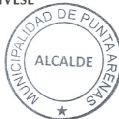
VLADIMIRO MIMICA-CARCAMO ALCALDE