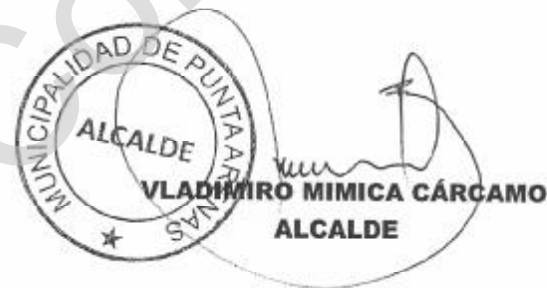
VLADIMIRO MIMICA CÁRCAMO ALCALDE