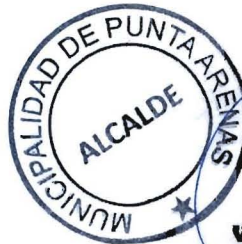
VLADIMIRO MIMICA CARGAMO ALCALDE COMUNA DE PUNTA ARENAS