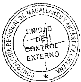
Jefa Unidad de Control Externo Contraloría Regional de Magallanes y de la Antártica Chilena